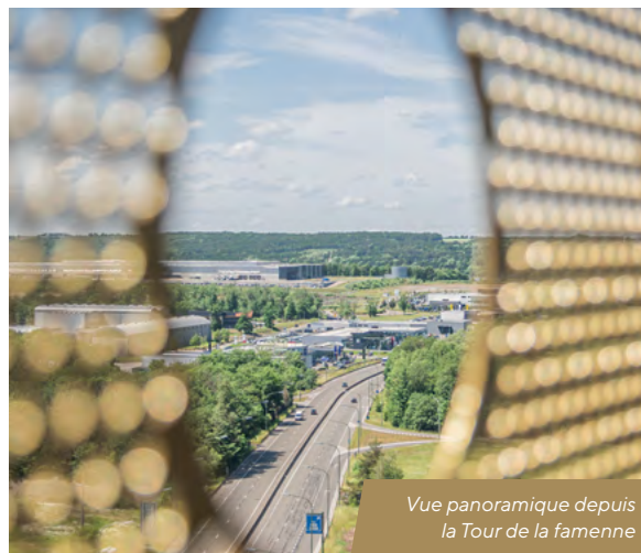
Vue panoramique depuis la Tour de la Famenne

Nous avons également ouvert une nouvelle salle design et luxueuse au pied de la Tour de la Famenne, qui a été entièrement rénovée avec un nouveau point de vue panoramique à couper le souffle sur la région et les reliefs des Ardennes. Citons également le Circus Casino de Huy, qui a ouvert ses portes fin août, et le Circus Casino d'Herstal qui sera inauguré début octobre. Nous avons également fait l'acquisition de 4 salles Palladium qui seront transformées d'ici la fin de l'année.